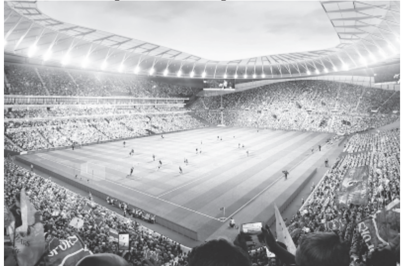
Az új sportlétesítmény látványterve

Azt még nem tudni, hogy október 28-án a Manchester City elleni rangadót már új otthonában játszhatja-e a csapat.